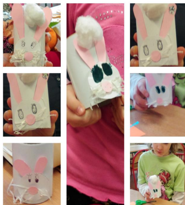
Zajaczek z papieru kolorowego