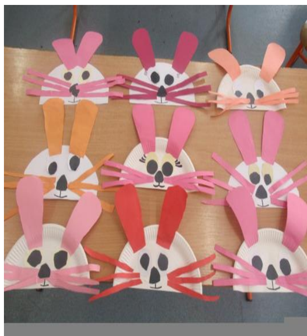
Zajaczek z talerzyka papierowego