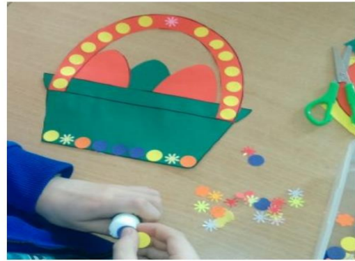
Koszyczek z kolorowego papieru