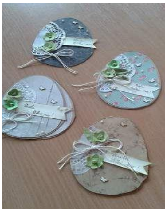
Kartka z korka i tapety